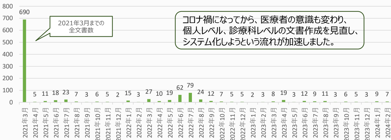
臨床倫理委員会承認済み文書数一覧